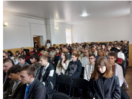
Учасники академії з нагоди завершення навчального року.

лежно від віку, будуть завжди гордо нести ім'я – манівець. Наша манівська родина з кожним роком стає більшою. І ми радіємо, адже знаємо, що українська наука буде мати майбутнє!