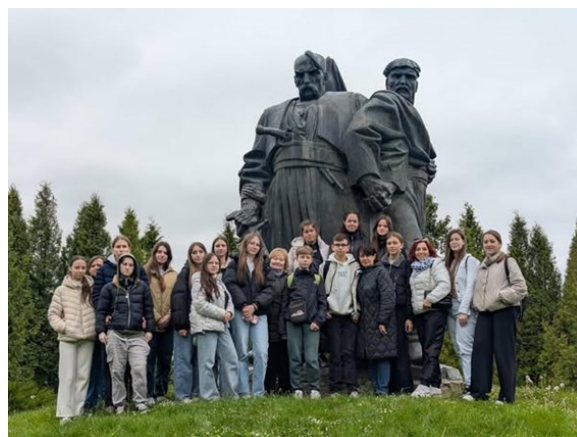
Матеріал на основі сайту: https://www.mansokal.school.social/

на початку ХХ століття було створено меморіальний комплекс, побудований на честь подвигу козаків та селян, полеглих у битві під Берестечком. Екскурсивод провела цікаву мандрівку місцями козацької звитяги, розповіла про козаків – захисників рідної землі, які мужньо боронили Україну в часи лихоліття. Погода, чудове товариство і бажання пізнавати історію, все це створило незабутню атмосферу подорожі.