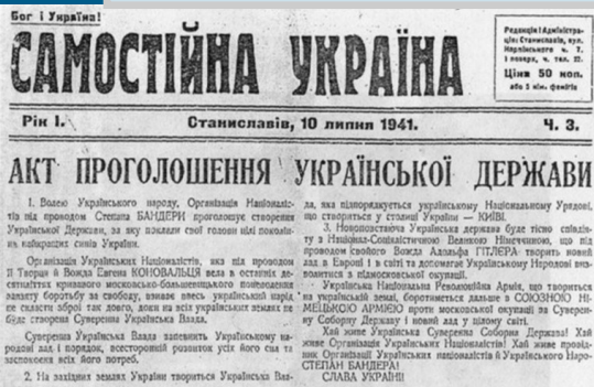
Публікація тексту Акта відновлення Української держави в газетах Галичини.

Незважаючи на те, що Акт не призвів до негайного відновлення незалежної Української держави, він мав значні історичні наслідки. Він став важливим символом боротьби за українську державність, що надихав наступні покоління борців за незалежність.