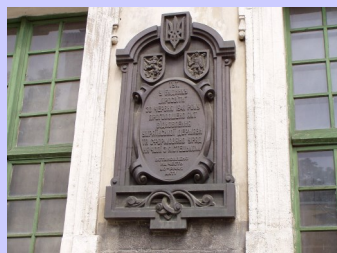
Пам'ятна дошка на честь 50-річчя прийняття Акта.

Пастирський лист Митрополита Андрея Шептицького, 1 липня 1941 року.