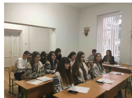
Захист робіт у відділенні філології