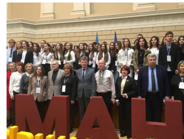
Манівці Сокаля на захисті робіт у Львові. 8 березня 2025 року.