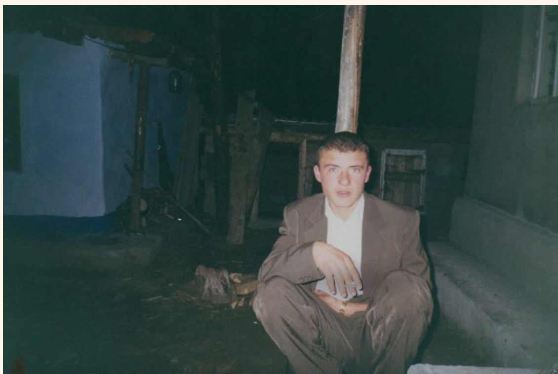
відпочинок із сусідом