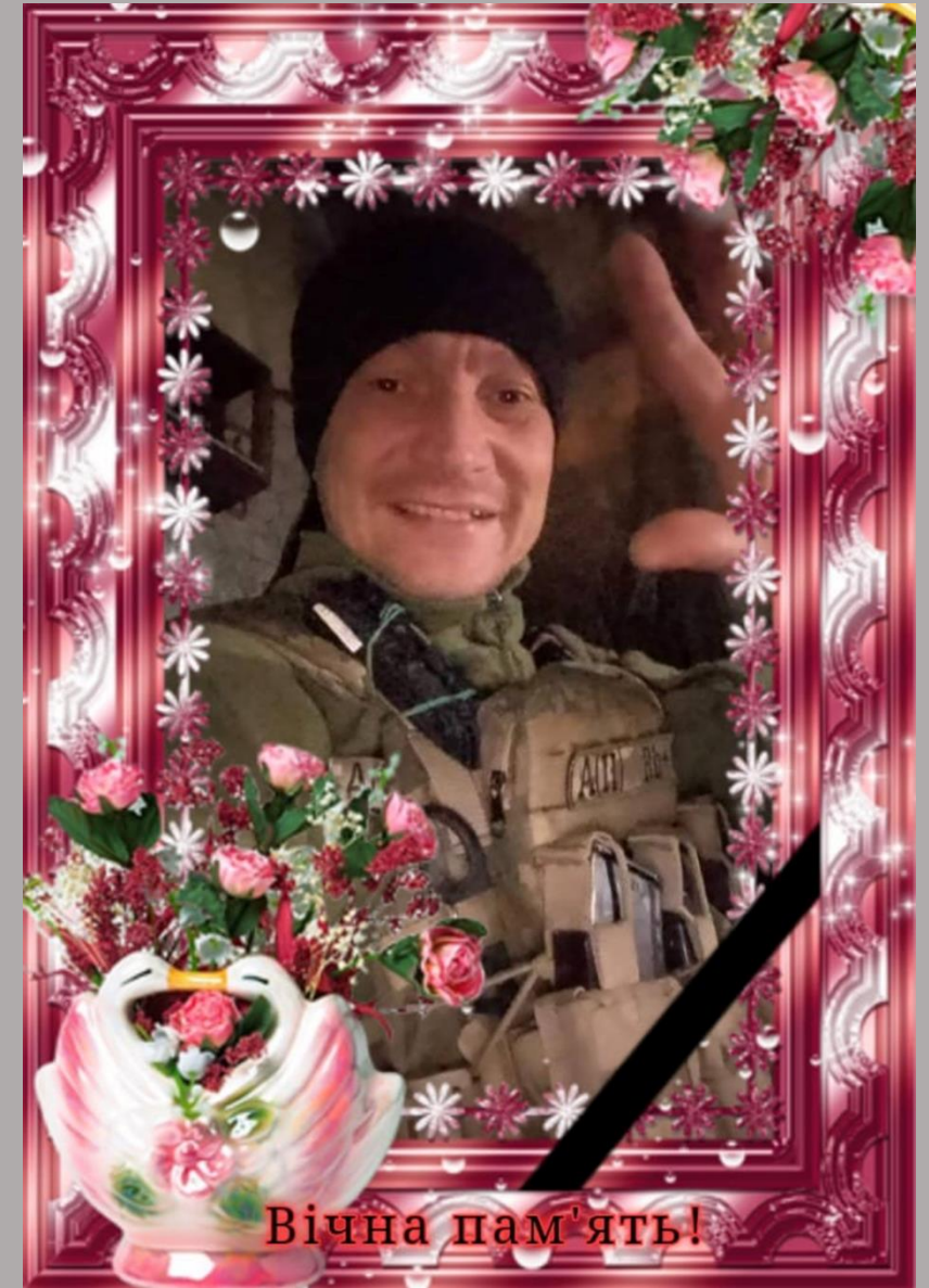
Фото. Колаж з фейсбуку (робота МАМИ)