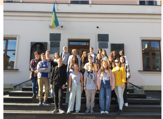
Сокальські манівці перед музеями: зоологічним та мінералів.

22 вересня, слухачі Сокальської МАНУМ побували на обласному Фестивалі позашкілля. Львівська обласна МАН провела в рамках Обласного форуму позашкілля «Розвиток освіти – шлях до перемоги» науковий захід «Поринь у світ науки», який зібрав до близько 700 учнів, педагогів та науковців з різних куточків Львівщини. Цей день став справжнім святом науки та творчості, під час якого учнівська молодь мала можливість зануритися в атмосферу наукових інновацій. У рамках Форуму було відкрито сучасну хімічну лабораторію Львівської обласної Малої академії наук учнівської молоді на базі хімічного факультету Львівського національного університету ім. І. Франка. Наступний крок – відкриття й оснащення фізичної лабораторії. У приміщенні МАН на Коперника, 42, захід відбувався на чотирьох локаціях, кожна з яких пропонувала унікальні активності. Зокрема, учні мали можливість взяти участь у майстер-класах з програмування («Веселе кодування»), пограти в