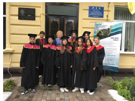
Слухачі Сокальської МАНУМ.

ську родину, бережіть і примножуйте її традиції, запроваджуйте інновації, пропонуйте нові ідеї і ми спільно їх реалізуємо. Гордіться тим, що ви є частинкою позашкільного закладу Сокальщини, який формує еліту. Переконана, що майбутнє належить вам, молоді люди. Гордимось випускниками, радіємо за наших випускників, які стали студентами омріяних вишів і сьогодні дякують академії. Найкраще, що можуть зробити батьки – це дати своїй дитині якісну освіту, відкрити доступ до різних можливостей та допомогти знайти себе. Вітаю сьогодні батьків, які зробили важливий крок у розвитку своєї дитини – запропонувавши їй профілізацію і профорієнтацію в МАН. Батьки довірили нам, педагогам закладу позашкільної освіти, своїх дітей. Для нас – це велика честь і велика відповідальність. Вірю, що ми педагоги, і ви – найкращі діти своїх батьків, оправдаємо їхню довіру. Плідного і мирного нового навчального року!»