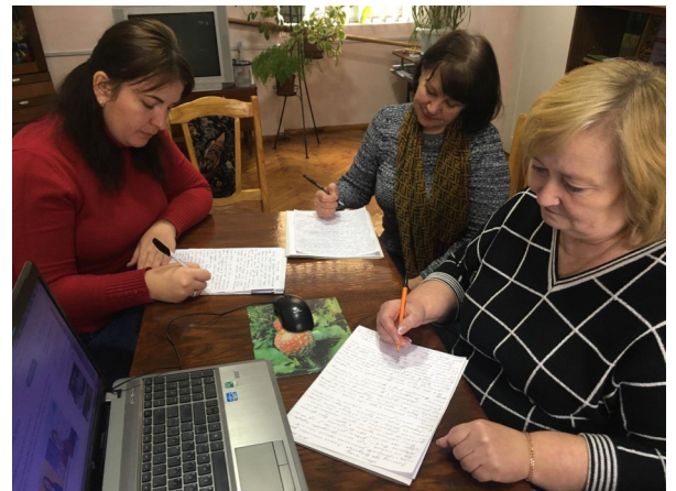
Написання радіодиктанту працівниками Сокальської МАНУМ.

25 жовтня – участь у радіодиктанті «Магія голосу» з нагоди Дня української писемності та мови