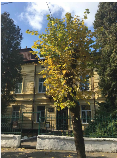
Будівля Сокальської МАНУМ.

Кожного року проводиться анкета із дванадцяти питань. Цьогоріч в опитуванні взяло 120 учнів 9-11 класів. Це ті учні, які вперше прийшли на навчання до закладу. На питання «як ви дізнались про такий заклад» учні відповідають: від старших братів і сестер, які тут навчались або від однокласників. На питання «чому ви стали слухачем МАН» – хочу вдосконалити свої знання; цікавлять запропоновані уроки та лекції з психології, історії, права; хочу знайти своє покликання для професії; краще вивчити теми, які мене цікавлять; стало цікаво вивчати щось нове; захотілось вивчити фінансову грамотність, польську мову.