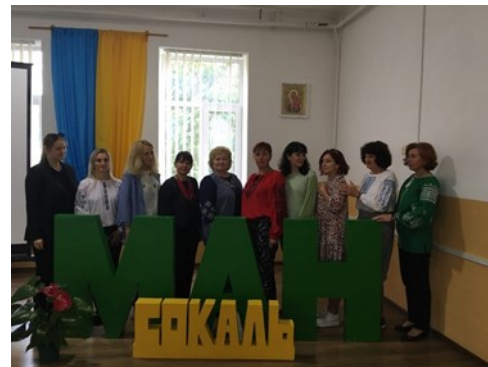
Педагогічний колектив Сокальської МАНУМ