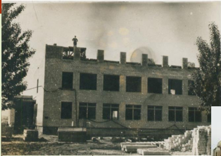
Школа, збудована на кошти колгоспу "Нове життя"