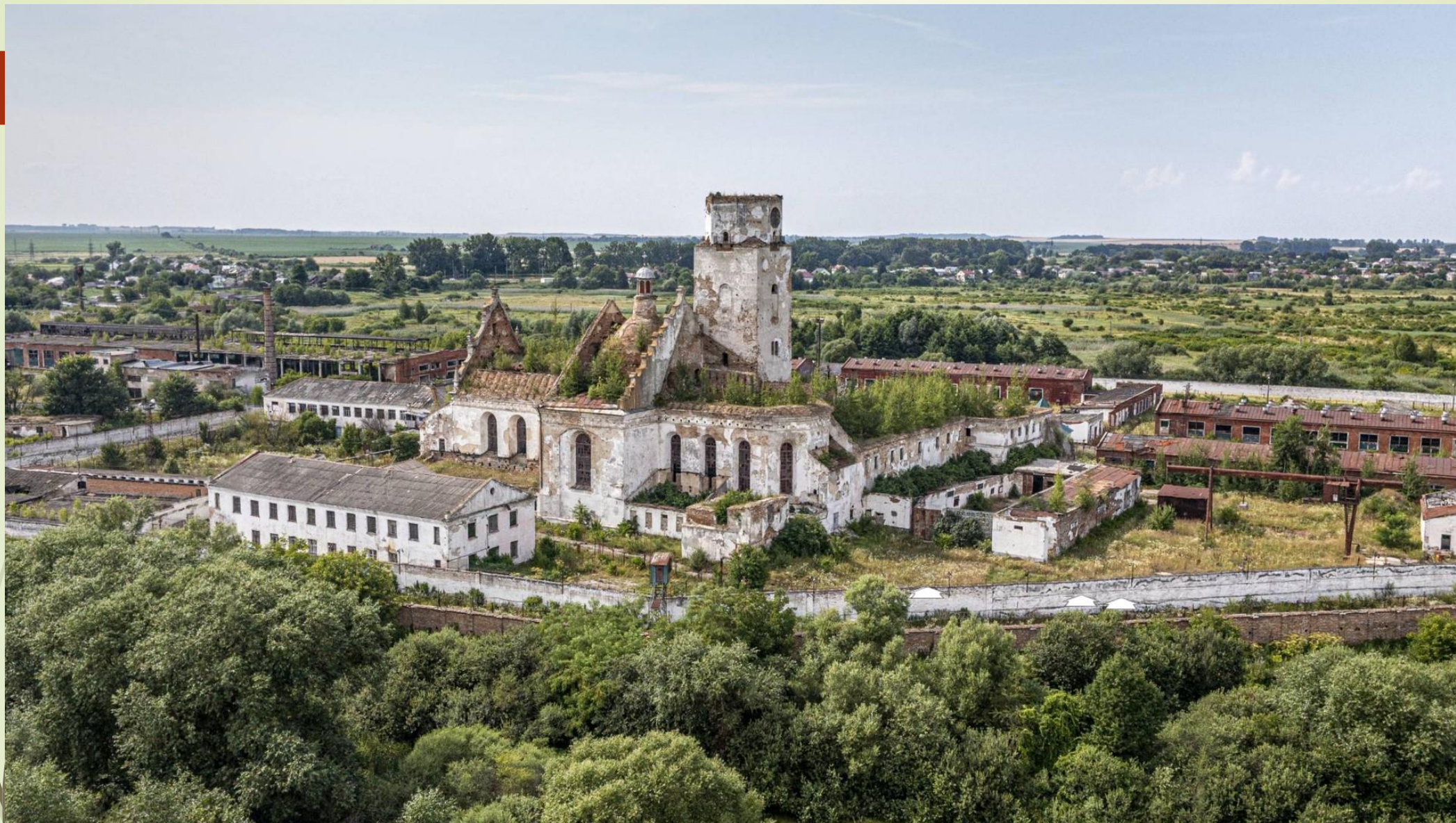
Сучасний стан монастиря Бернандинів (фото з дрона)