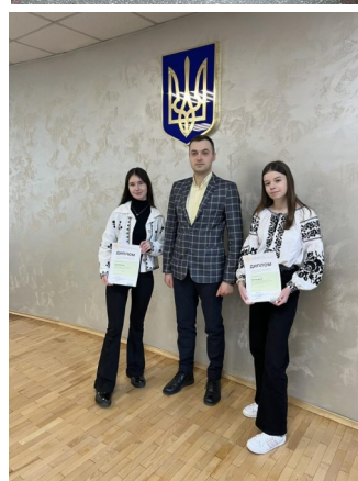
Слухачі Сокальської МАНУМ на обласному етапі конкурсу