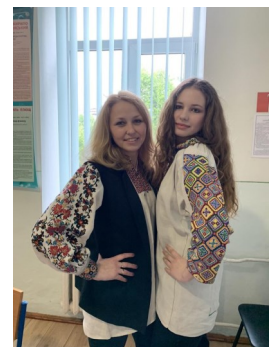
Учасники конкурсу «Мій родовід»